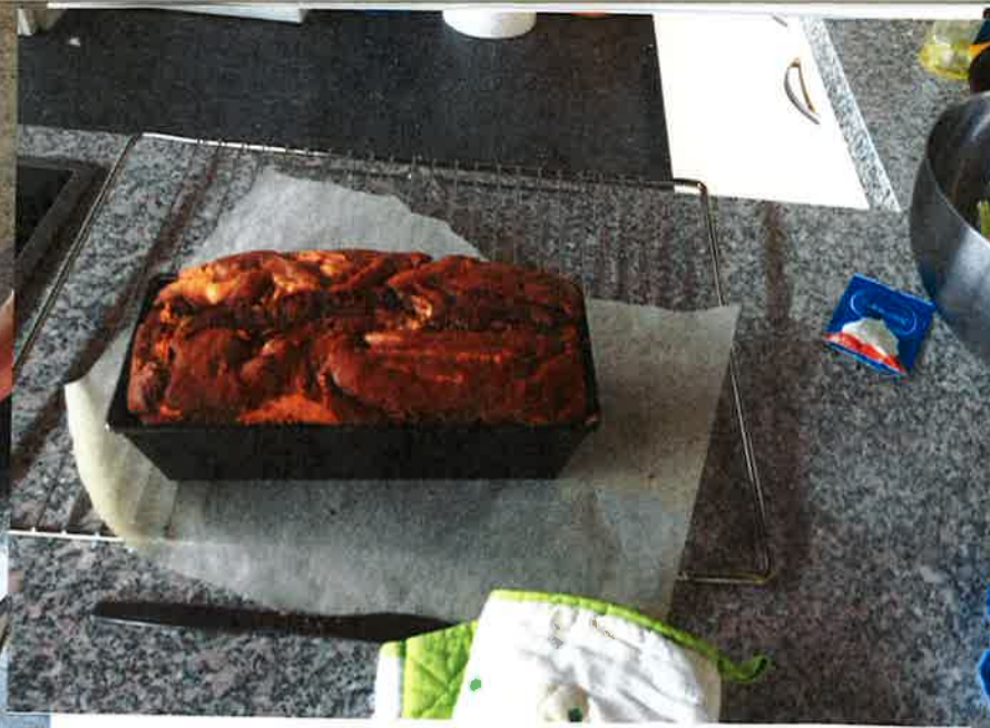
Ein fertiger Marmorkuchen.