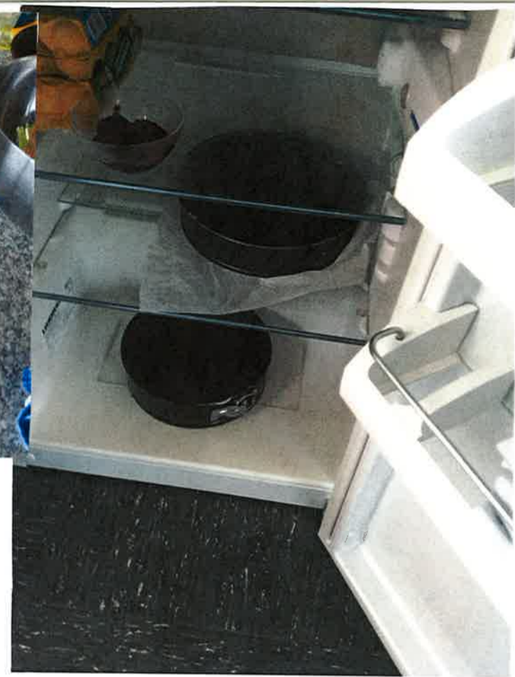
Kuchen für morgen