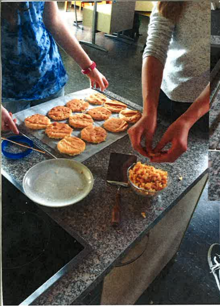
Hier werden Kuchen vorbereitet.